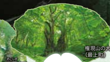
権現山の大家ツラ (最上町)