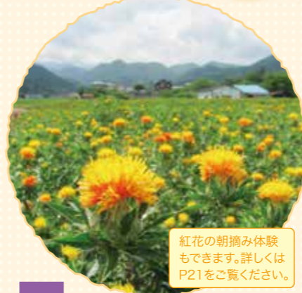
紅花の朝摘み体験もできます。詳しくはP21をご覧ください。

山形紅花まつり [山形市] 映画「おもひでぼろぼろ」の舞台のモデル・山形市高瀬地区で開催する紅花の祭り。紅花観賞のほか、郷土芸能や紅花染め体験などを実施します。 日程/7月上旬