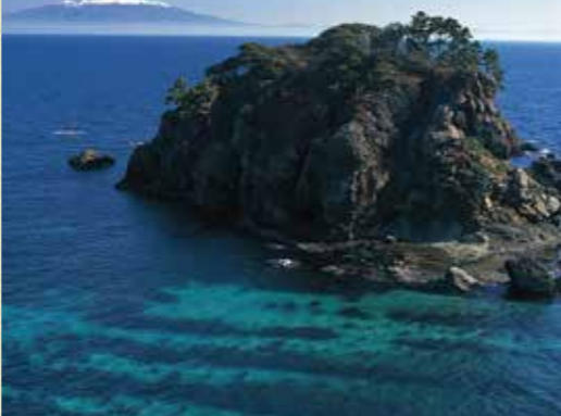
飛鳥から見える鳥海山

(酒田エリア)玉簾の滝・鶴間池等 (飛鳥エリア)鳥帽子群島・ゴト口浜等 (遊佐エリア)丸池様・牛渡川・洞腹滝・ニノ滝等 間/鳥海山・飛鳥ジオパーク推進協議会 ☎0184-62-9777