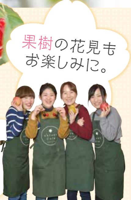
高橋フルーツランド スタッフのみなさん

当園ではさくらんぼをはじめ、さまざまなフルーツを100%有機肥料で育てています。じつは果実って花もきれいなんです。3月下旬から5月の中旬にかけて、さくらんぼやラ・フランスの“開花リレー”が楽しめます。ほかの果樹園でも桃やりんごの可憐な花が咲き揃い、見事な花回廊を作ります。ぜひ「果樹のお花見」も楽しんでください。