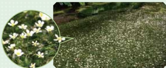
うしわたり牛渡川 [遊佐町]

場所/遊佐町直世字荒川地内 交通/JR羽越本線吹浦駅から車で約10分 間/遊佐鳥海観光協会 ☎0234-72-5666