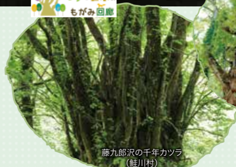
藤九郎沢の千年カツラ (鮭川村)