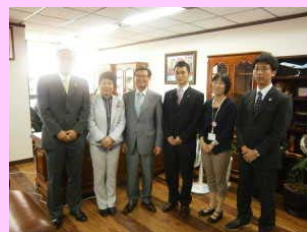
韓国観光協会中央会訪問