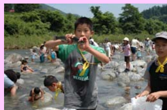
朝日川溪流まつり