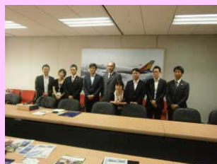
アジアナ航空訪問