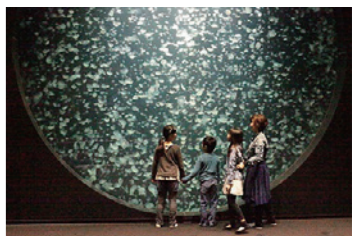
5 加茂水族館 (38分)