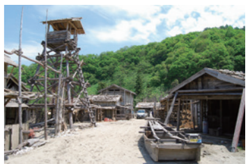
8 スタジオセディック 庄内オープンセット (43分)