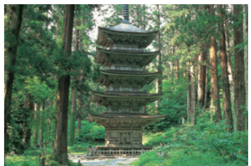
7 国宝羽黒山五重塔 (30分)