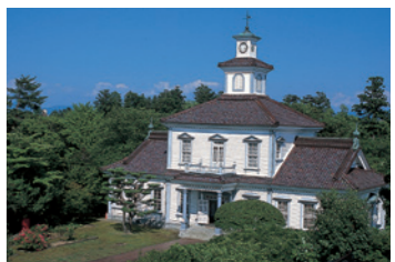
6 致道博物館 (25分)