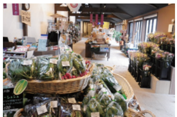
4 庄内町新産業創造館クラッセ (48分)