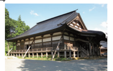
9 注連寺 (28分)