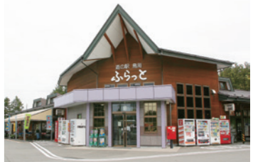
1 道の駅鳥海ふらっと (70分)