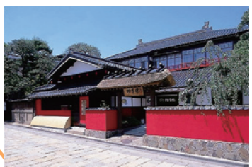
2 舞娘茶屋 雛蔵画廊 相馬楼 (52分)