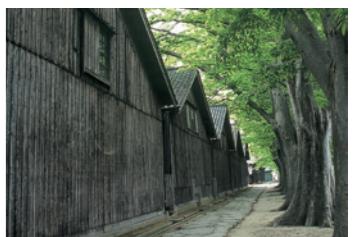
3 山居倉庫 (48分)