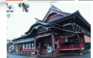
10 大日坊 (25分)