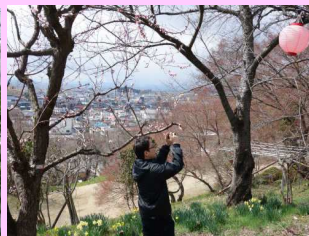
烏帽子山公園（南陽市）