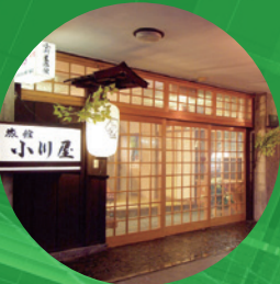
各旅館にて特別割引