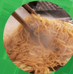
イベントで使える お食事券プレゼント