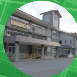
イベント入場料無料