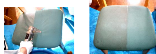
左：洗浄前 右：洗浄後

17,000円（税込：18,360円）~ 家庭用椅子5脚 又は ソファ（二人掛け）2脚