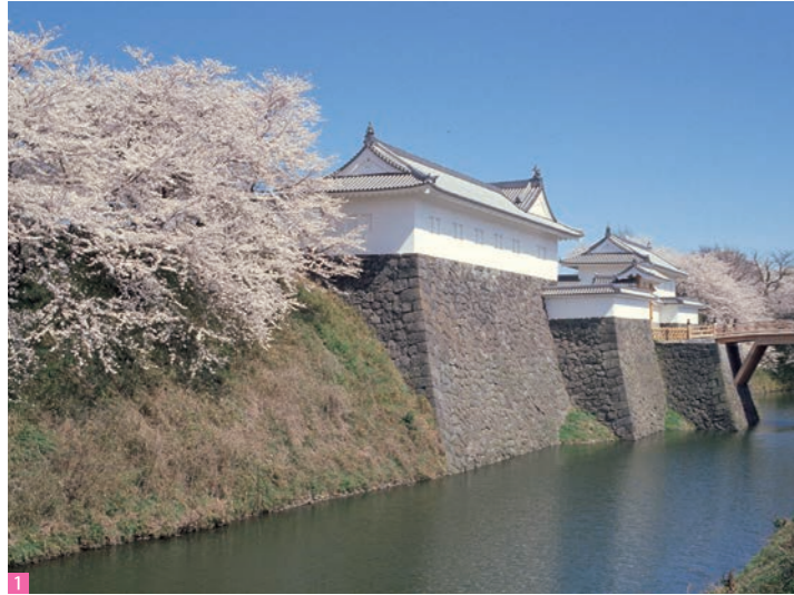
1 霞城公園(山形市) 山形城二ノ丸跡である霞城公園は、約1,500本の桜が咲き誇る名所。お堀端に咲く桜は、満開の時期には列車がゆっくり走るという粋な計らいも。