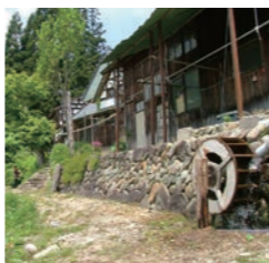
※数字の番号は、21ページの飯豊町中津川マップの中に表示しています。