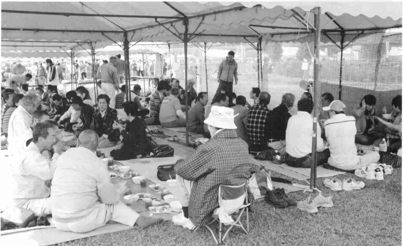
秋空の下で開催された「会員の集い」、95名の会員が交流を楽しんだ。(10/1)