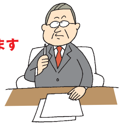
株式会社オールアバウト社の知的資産経営報告書(2005)