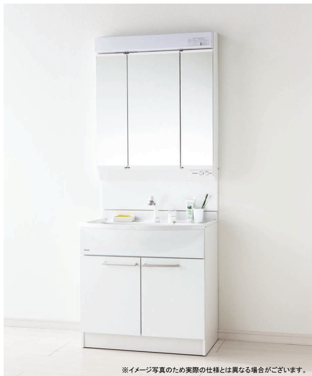
※イメージ写真のため実際の仕様とは異なる場合がございます。