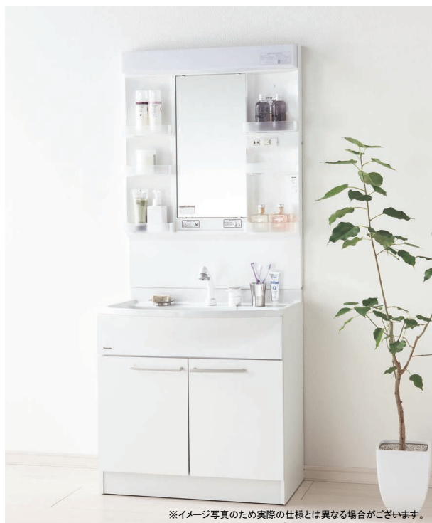
※イメージ写真のため実際の仕様とは異なる場合がございます。