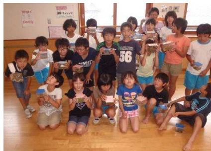
【生き物と一緒に記念撮影】

◆学校のすぐそばにある田んぼを活用して、お米づくりだけでなく、絵をかいたり、虫の音をきいたり、いろいろな視点で生きものとのふれあいの場を増やし、田んぼのある風景を守ってもらいたいと思います。