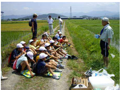
【米沢市立塩井小学校のみなさんとの調査】

◆このトンボはハグロトンボです。調査の時にはいませんでしたが、7月になると沢山見ることができます。