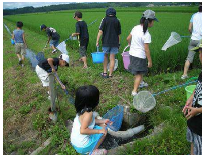
生き物の活動場所(水田)