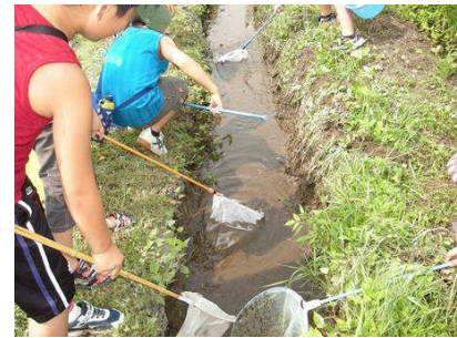
生き物の活動場所(水路)