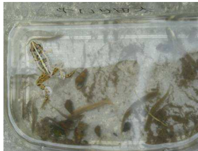
巻貝、かえる、どじょう