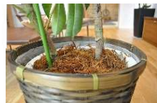
観葉植物もグッと引き立ちます！