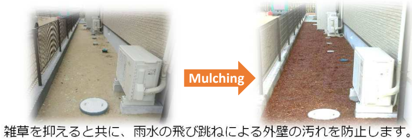
雑草を抑えると共に、雨水の飛び跳ねによる外壁の汚れを防止します。