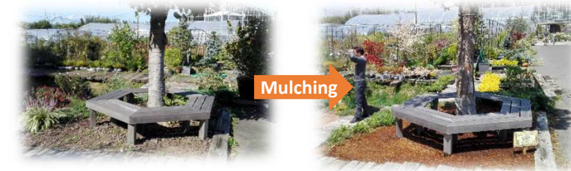
土がむき出しのベンチ周りをイデアルファイバーでマルチング。