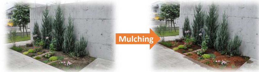
既存の植栽を活かしたマルチング。見違えるほど花の色が際立ちます。